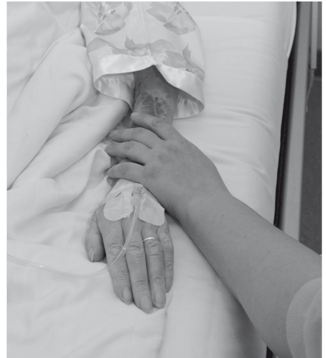
2. Ethiktag der Universitätsmedizin Mainz