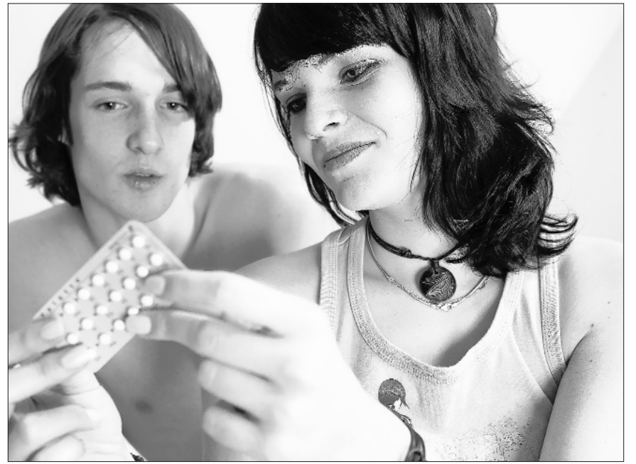
Ein junges Paar mit einer Pillen-Packung zur Schwangerschaftsverhütung.

spielt, hat es die Pille dagegen schwer – trotz staatlich geordneter Ein-Kind-Politik und selbst, wenn das Verhütungsmittel teilweise staatlich subventioniert von den Gesundheitsbehörden angeboten wird. Eins hat die Pille auf der ganzen Welt erreicht: Sie hat Sex endgültig von der Fortpflanzung abgekoppelt. Für den Mainzer Professor Paul ist sie darum ein wichtiger Schritt auf dem Weg zur Kontrolle der Biologie, der seinen vorläufigen Höhepunkt in der Möglichkeit der künstlichen Befruchtung gefunden habe. »Die größere gesellschaftliche Umwälzung ist nicht, dass man durch die Pille Sex haben kann, ohne sich fortzupflanzen, sondern dass man sich durch neue Laborverfahren fortpflanzen kann, ohne Sex zu haben«, sagt er.