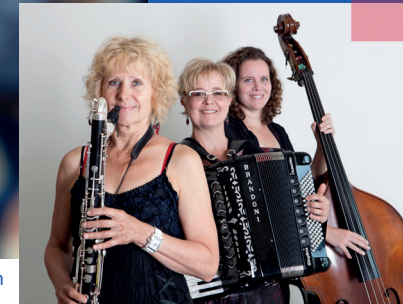
Trio KLEZMERS TECHTER

Hörsaal Chirurgie der Universitätsmedizin Mainz 17.15 Uhr