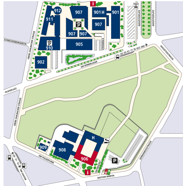
Gebäude 906 / Erdgeschoss

Universitätsmedizin der Johannes Gutenberg-Universität Mainz, Langenbeckstr. 1, 55131 Mainz