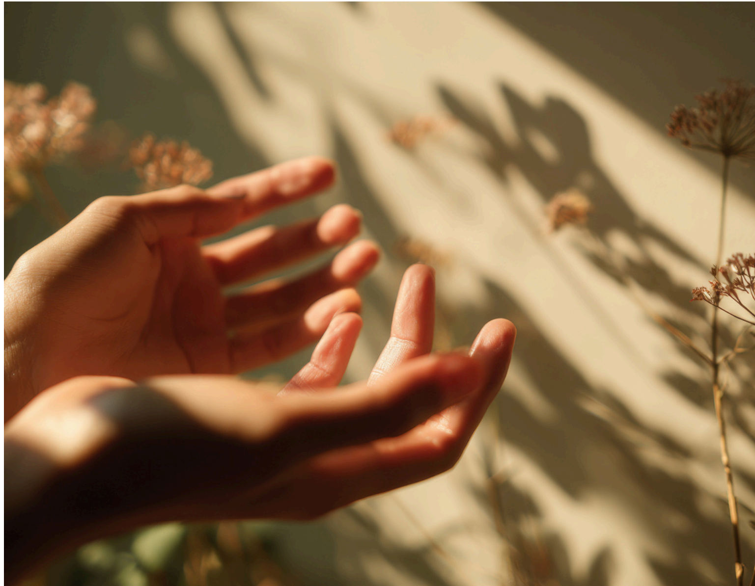
Julia Schütz Fachgesundheits- und Kinderkrankenpflegerin für pädiatrische Intensivpflege