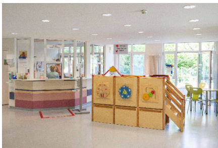
Leitstelle Kinderpoliklinik Gebäude 109, Erdgeschoss, rechts

Wann muss mein Kind am Tag der OP auf der Station sein?