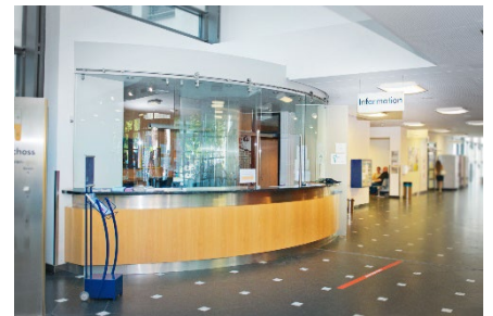
Anästhesiesprechstunde 2 Gebäude 102, Erdgeschoss, Raum 0.921