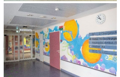
Bild 1 Patientenaufnahme Bild 2 Eingang Station A3