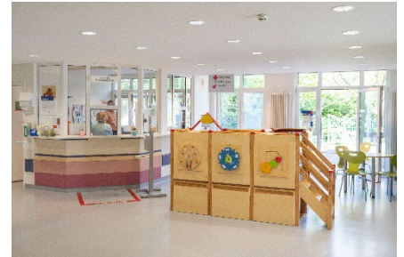
Leitstelle Kinderpoliklinik Gebäude 109, Erdgeschoss, rechts