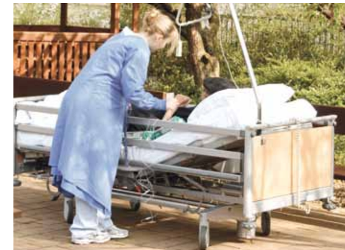
Patient mit einer Pflegekraft im Garten der Palliativstation

Hier setzt die „Mainzer Palliativstiftung – Leben bis zuletzt“ an.