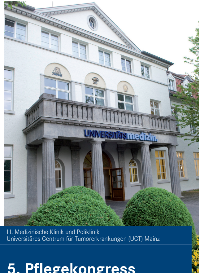
III. Medizinische Klinik und Poliklinik Universitäres Centrum für Tumorerkrankungen (UCT) Mainz